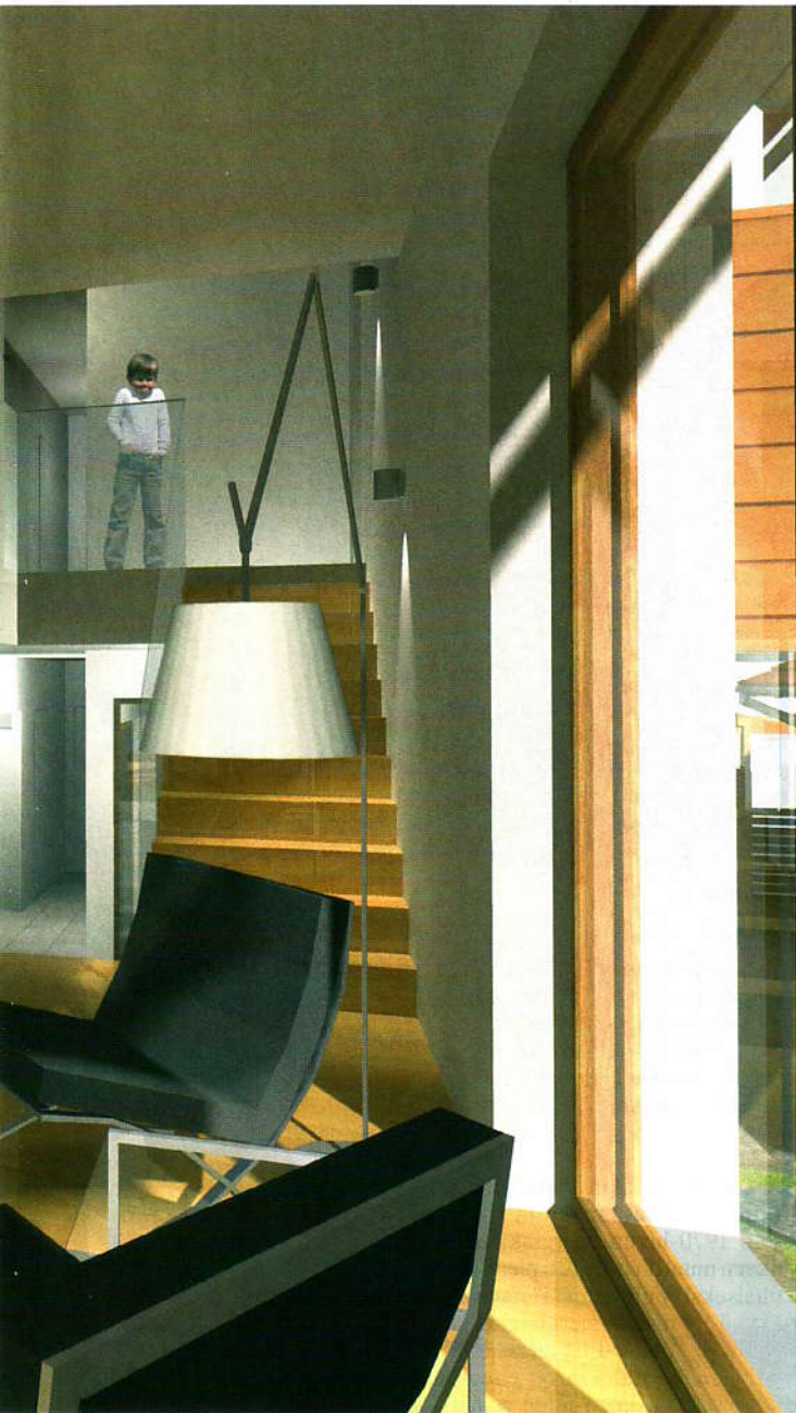
Matalaenergiatalo Villa Real on suunniteltu valoisaksi ja viihtyisäksi kodiksi. Energiatohokkuus ei karsi millään tavalla asumismukavuutta.

Tontin sijainti ja pinnanmuoto vaikuttavat energiankulutukseen. Rakennuksen sijoittelu tontille rajoittavat kaavamääräykset. Ihanteellista olisi, jos taloon saataisiin etelästä auringonpaistetta ja pohjoisen puolella olisi suojaa esimerkiksi maastonmuodosta tai metsästä.