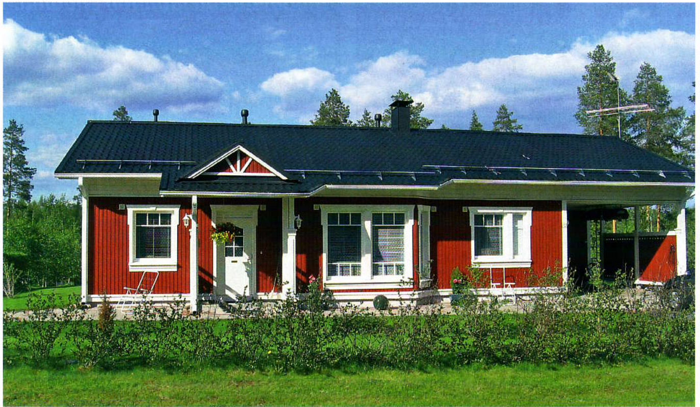
Myös kotoisa puutalo voi olla matalaenergiatalo. Mäntykumpu on Jukka-talo.

omakotitalotuotannon lämmitysenergian säästötavoite on 35 prosenttia. Energiansäästöohje on viitteellinen ja perustuu kaksikerroksisen, suorakaiteenmuotoisen omakotitalon tilaratkaisuun ja talotehtaiden keskimääräiseen tuotantoon.