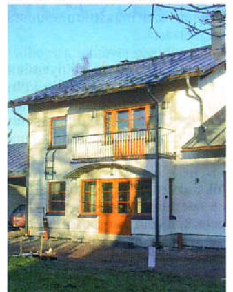
Tämä Jämerä-matalaenergiatalo on rakennettu Siporex-kevytbetoniharkoista.