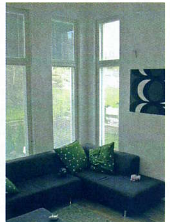
Helsinkiläisen matalaenergiatalon olohuoneeseen on tehty korkeat ikkunat.

Villa Realin tontti oli matalaenergiatalolle sopiva, sillä oleskelutilojen isot ikkunat oli helppo sijoittaa etelään ja länteen ja pienet kadun puolelle pohjoiseen. Talosta haluttiin valoisa, joten useimmat ikkunat ulottuvat lattiasta kattoon saakka.